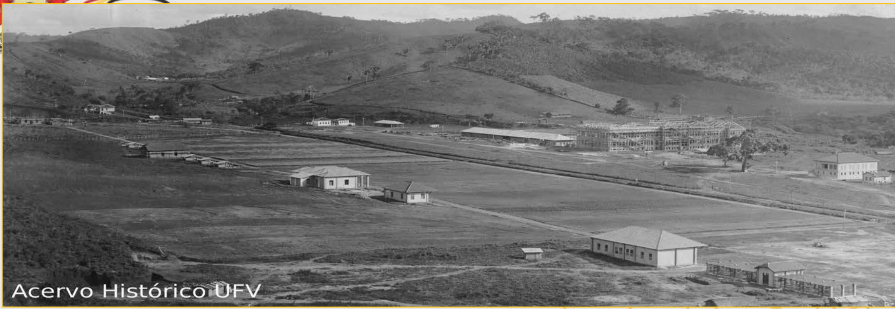
Acervo Histórico UFV